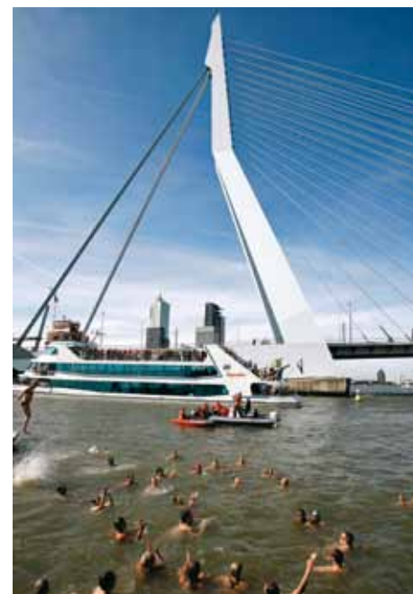
Rondje Noordereiland 2010

Met het Rondje Noordereiland in hartje Rotterdam vragen wij elk jaar op de laatste zondag van juli aandacht voor het meest succesvolle Europese Milieuproject.