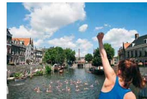
Delfshavense Schiekampioenschappen 2010

www.delfshavenseschiekampioenschappen.nl